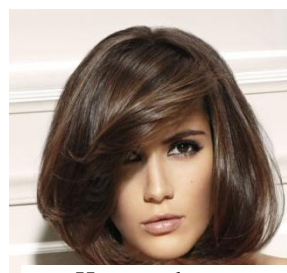
Hauteur de ton châtain clair