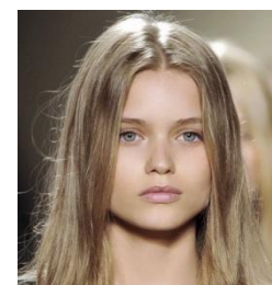
Hauteur de ton blond