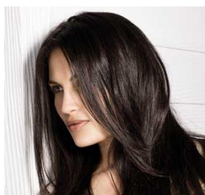
Hauteur de ton brun

La couleur finale du mélange, dépend des proportions de ces couleurs allant du noir au blond très clair.